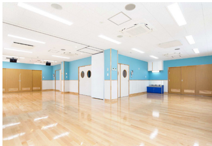
5 歳児保育室・遊戯室